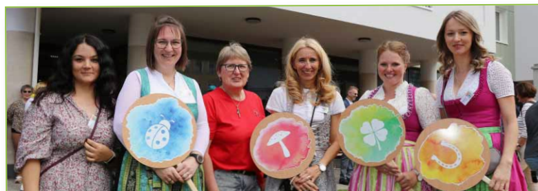
Das Team im »Kindergarten im Zentrum«