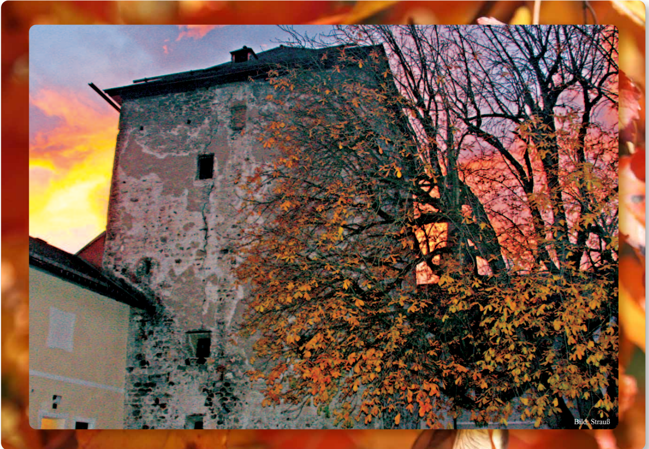
Abendstimmung über dem Kastenturm: Ausblick auf den Herbst mit gemischten Gefühlen

Sehr geehrte Bürgerinnen und Bürger, liebe Jugend!