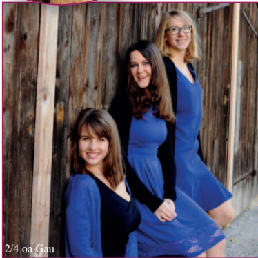
2/4 oa Gau