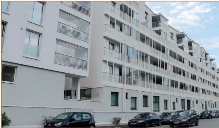
Die Fassade in der Leitgebstraße wird begrünt. Die Halterungen für die Pflanzen sind bereits montiert.