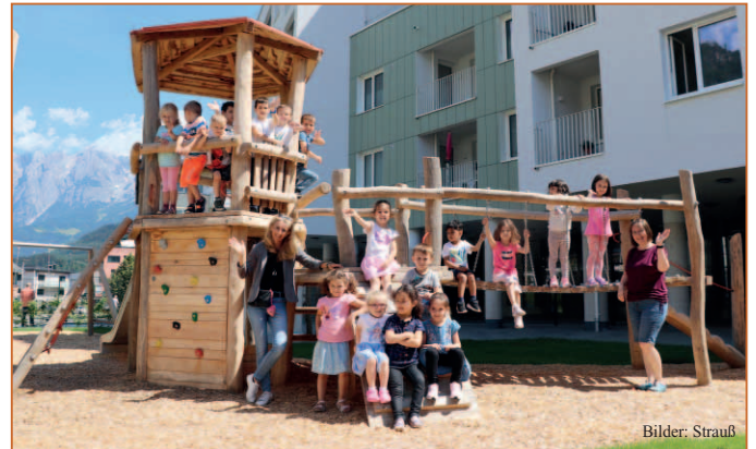
Der »Kindergarten im Zentrum« in der Salzburgerstraße. Kinder vom Kindergarten Neue Heimat beim »Testen« der Außenanlage.