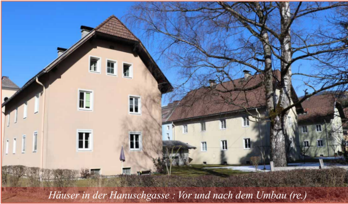
Häuser in der Hanuschgasse: Vor und nach dem Umbau (re.)