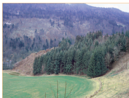
Das Naturdenkmal Kreuzberg gibt der Landschaft eine charakteristische Prägung