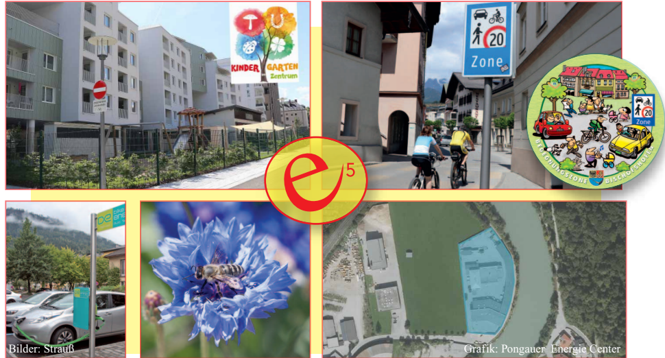
Vielfältige Maßnahmen wurden in den Bereichen Klimaschutz und Energieeffizienz umgesetzt.

Die e5- und Klimabündnisgemeinde Bischofshofen engagiert sich seit Jahren für den Klimaschutz. Aufgrund der Mitgliedschaft beim e5-Landesprogramm für energieeffiziente Gemeinden werden die Bemühungen der Stadtgemeinde