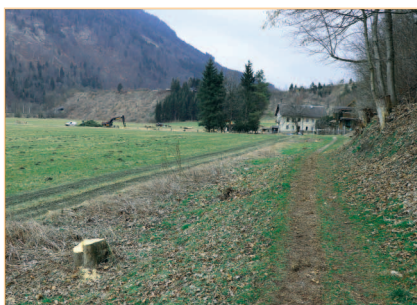
Die Sträucher entlang des Spazierweges wurden für die Grabungen entfernt

Das Gelände am Lackenhof/Fischerlehen wird aktuell für den Bau des neuen Sportzentrums Innergebirg vorbereitet. Die bestehenden Stromleitungen wurden bereits abgetragen, das alte Gebäude im Auftrag der Stadtgemeinde abgebrochen. In nächster Zeit werden die notwendigen Baumaßnahmen für die gesamte Infrastruktur durchgeführt. So wird u.a. die Hauptgasleitung Richtung Oberpinzgau umgelegt und es erfolgen die Vorarbeiten für die Errichtung der Zufahrt.